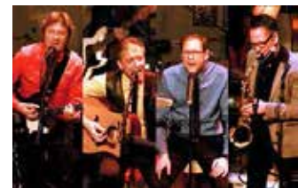
THE HITTILLS 4 mannaband Back to the sixties LIVE UNPLUGGED

Årets Företagare i Simrishamns kommun 2014 - Företagarna Albo/Österlen