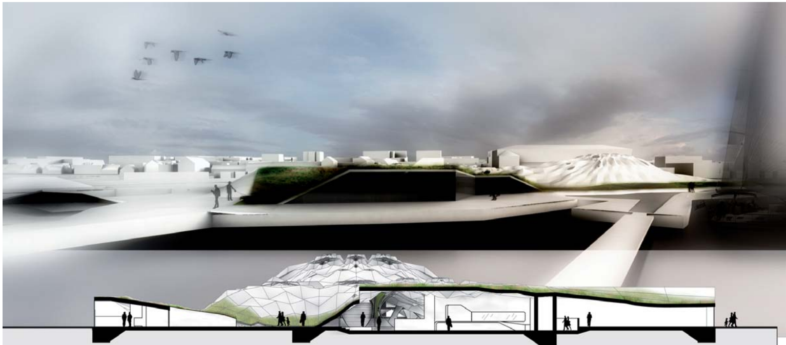
"Algaetecture" – en av många idémodeller för ett Marint centrum, som tagits fram av studenter vid Kungliga Tekniska Högskolan i Stockholm och AA School of Architecture i London.

En annan del av utställningen utgörs av examensarbetet från studenter vid Malmö högskolas utbildning Konst, kultur och kommunikation (K3). Studenterna har arbetat med frågeställningar som handlar om hur interaktionsdesign kan användas för att skapa engagemang för miljö samt hur naturvetenskaplig forskning kan presenteras på ett spännande och lättillgängligt sätt. En del i arbetet har varit att skapa en prototyp för interaktiva upplevelser och kunskapsinhämtning från naturen.