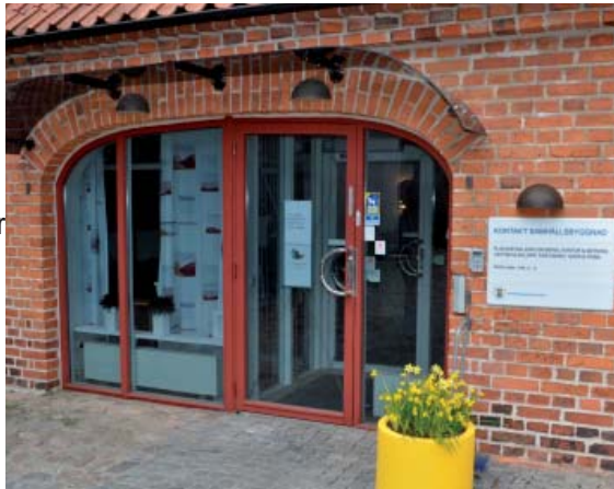
Entrén till Kontakt samhällsbyggnad

Alla som ringer får svar genom "Kontakt samhällsbyggnad". Man slipper jaga rätt person. I "Kontakt samhällsbyggnad" bokar man tid hos handläggare, antingen för besök eller för att bli uppringd. Förutom