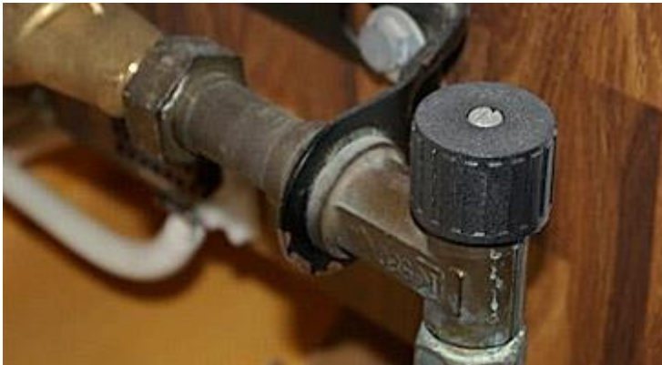
Figur X: Byt ut om du har en LK580 avstängningsventil.

Har du en avstängningsventil kallad LK 580 (se bild nedan) ska den bytas av våtrumsbehörig fackman innan Simrishamns VA avdelningen kan utföra byte av vattenmätare.