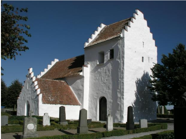
Hannas kyrka.