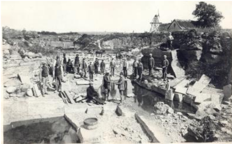
Arbetsbild från sekelskiftets Komstad. I bakgrunden "Sladdran", ett pumpverk som höll stenbrottet någorlunda fritt från vatten.

På 1880-talet fanns endast två hus och två småbruk där byn Gärsnäs ligger idag. På torgets plats fanns en stor vattensamling där folk brukade roa sig. Gärsnäs fick sin första tågförbindelse när Simrishamn-Tomelilla Järnväg öppnades 1882, 12 år senare tillkom Ystad-Gärsnäs Järnväg, främst för att betjäna sockerindustrin, och Gärsnäs-S:t Olofs Järnväg som öppnades 1902. Det första stationshuset var byggt av trä och flyttades till Gärsnäs gård där den blev bostadshus för gårdens anställda. Gärsnäs saftstation kom till området år 1920, dit sockerbeter transporterades för framställning av råsaft. År 1954 öppnades ett framgångsrikt kycklingslakteri med många anställda. Efter 45 år lades det ner.