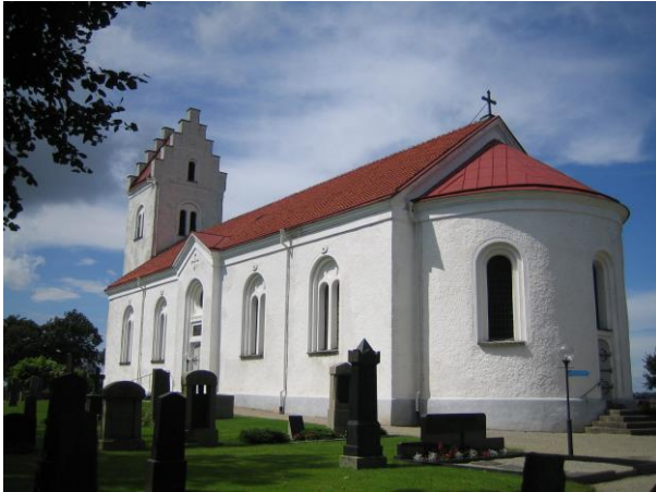
Stiby kyrka.